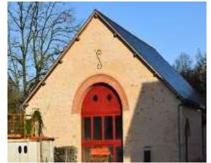
El Centro de Conferencias

Una buena noticia en 2019 fue que el diseño de Bonnevaux realizado por la firma DP Architects obtuvo Oro en los Premios de Diseño de Londres. La abadía está completa y el Centro de Conferencias abrirá en Enero. El siguiente objetivo es terminar con el Centro de Retiro en la segunda mitad de 2020. Para más información favor de visitar el sitio web bonnevauxwccm.org .