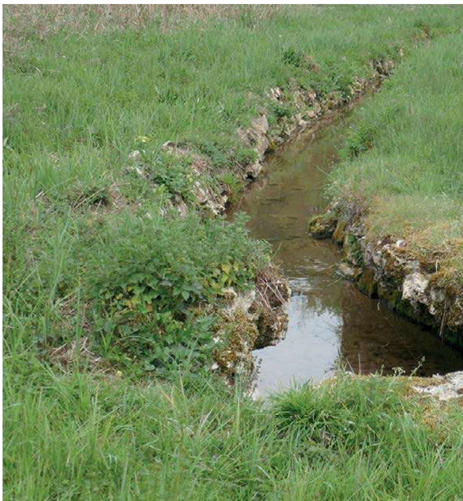
Una de las fuentes de Bonnevaux donde reside una antigua presencia

Laurence Freeman reflexiona cómo la meditación restaura la sabiduría que perdimos en la relación entre ascesis y amor