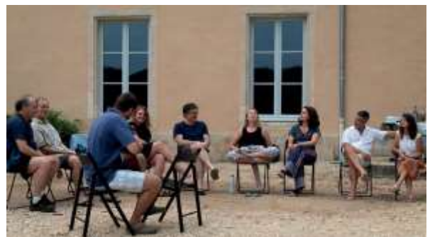
Encuentro en Bonnevaux después del Camino, agosto 2019

En Bonnevaux tenemos una cantidad de manantiales. Uno que tengo especialmente presente es el que está al final del valle, más allá de o que llamamos el Árbol del Este. Burbujea a través de una pequeña apertura en el suelo; es visible solo como una perturbación menor, trayendo pequeñas partículas de la tierra al abrirse paso al mundo visible. Es continuo y es fuente de un arroyo. Una antigua presencia reside ahí con signos residuales de construcción humana a su alrededor porque debe haber atraído a mucha gente, como hace la sabiduría, más allá de la memoria.